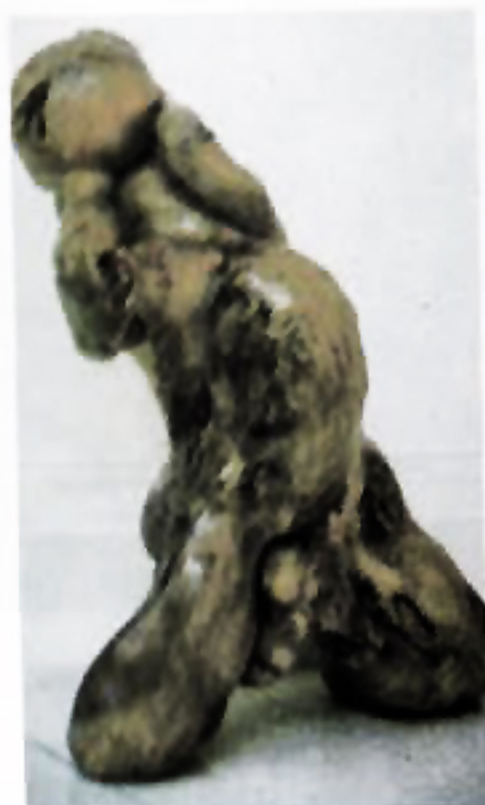
Mahayana " Kelahiran " Kayu Jepun 70 Cm