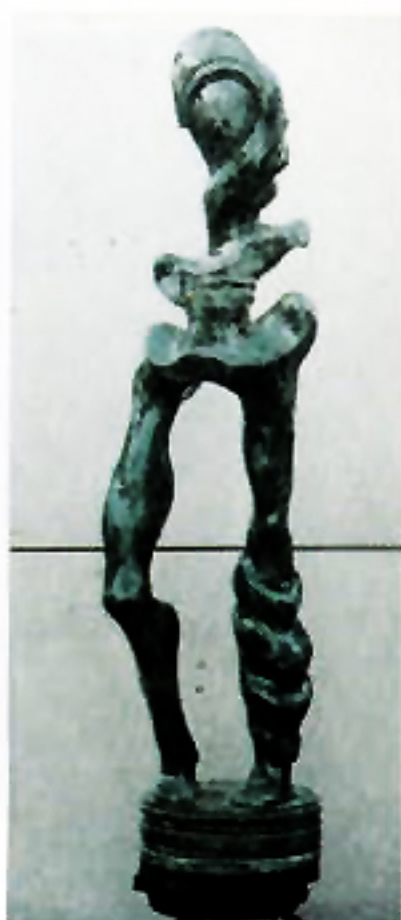
Cok Udiana "Korban Aids " Beton Polister 100 Cm