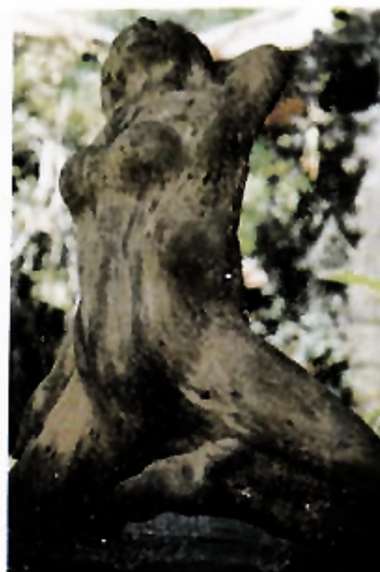
Sentana Yasa " Figur Woman " Kayu 80 Cm