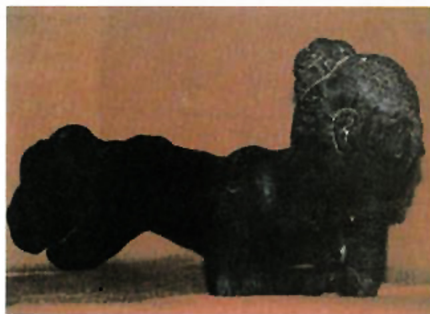
P a n d e " Melamun " Kayu 100 Cm