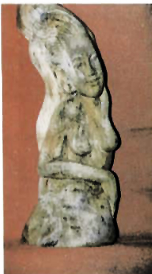
IB. Warsaka " Berpose " Kayu 70 Cm