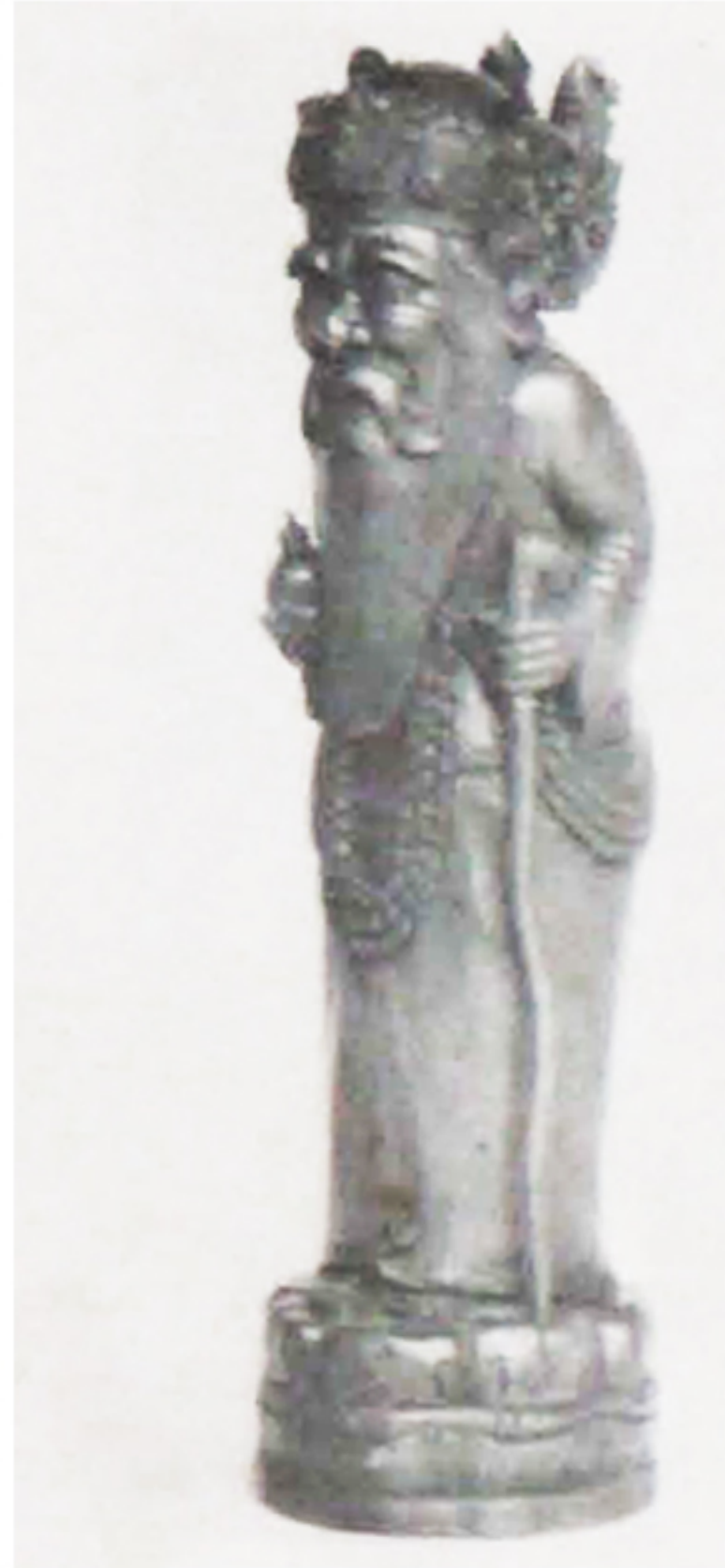
079/AC/P/74/SN PAN KERUG, Bungaya Karangasem, Begawan Werehaspati, Kayu sawo, 35x10x10cm.