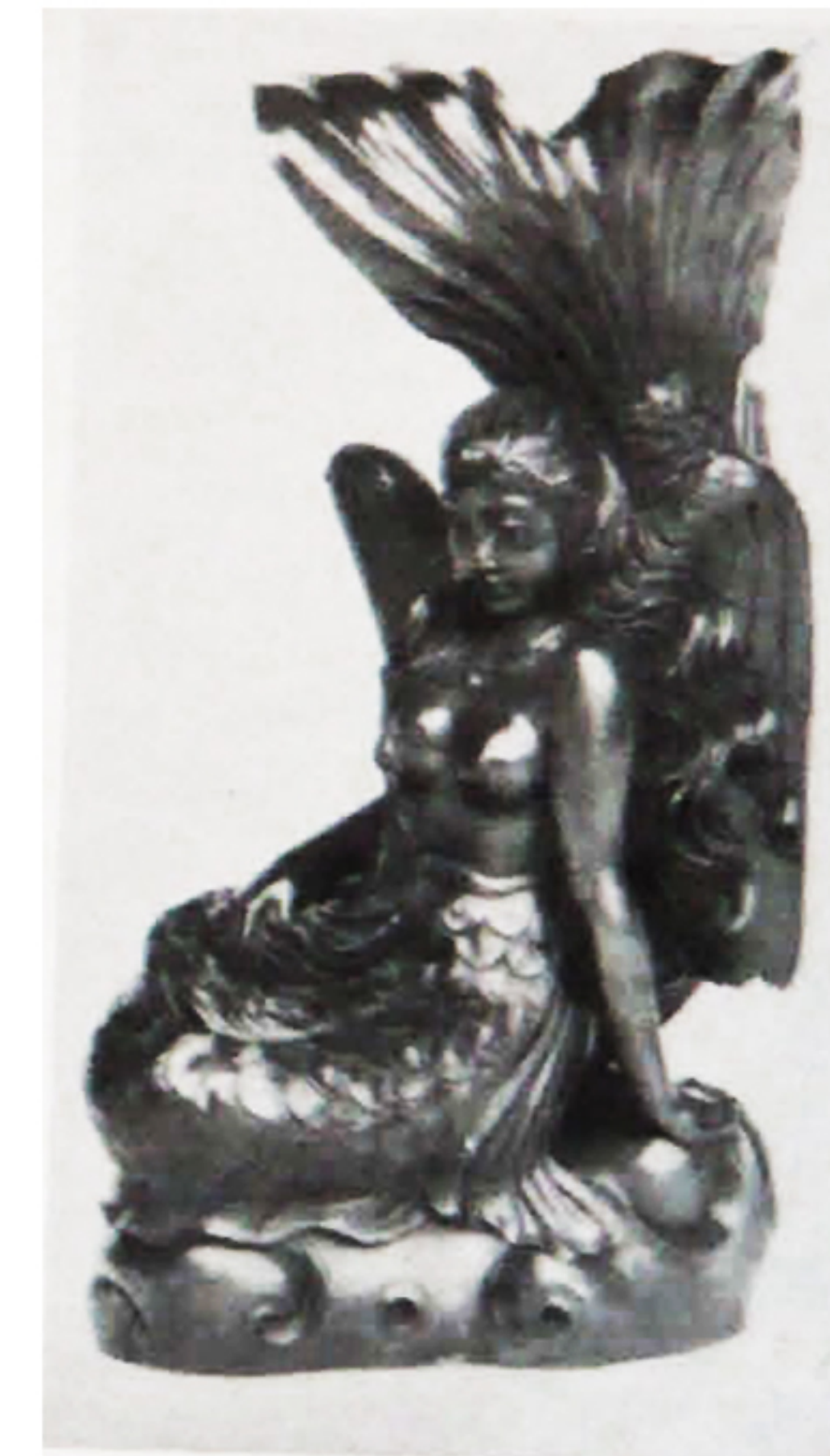
125/AC/p/79/S ANONIM Ikan duyung, Kayu sawo, 50x27x18cm.