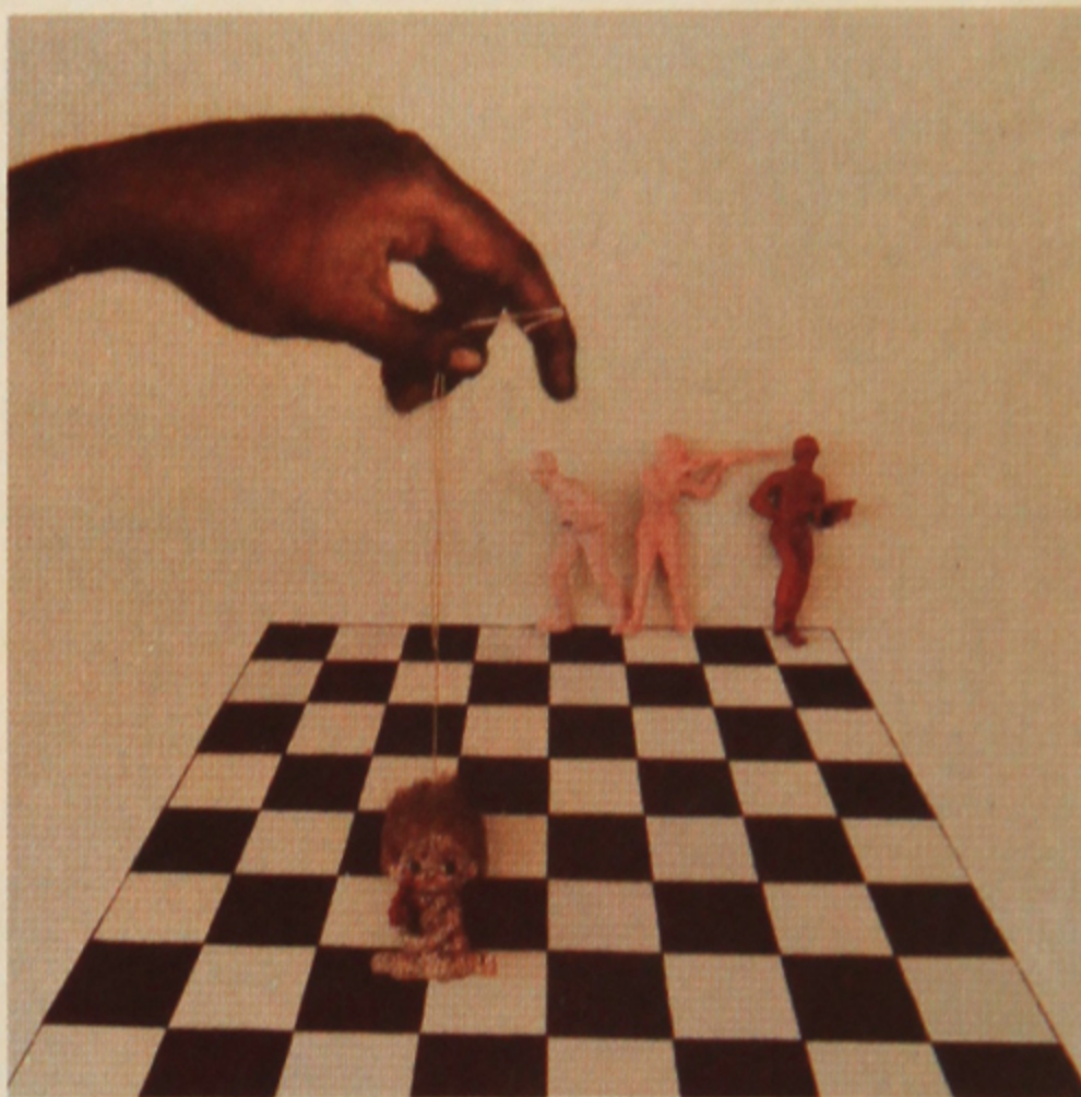
Dua karya Dyan. Menggunakan kemampuan melukis dan kebiasaan menggarap elemen-elemen tiga dimensional. (tengah bawah)