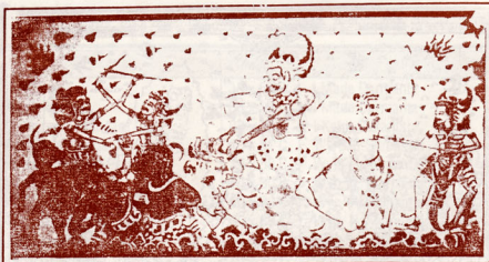
Pelukis : Ida Bagus Ketut Suta