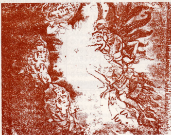
Pelukis : Gung Wayan Tjidera