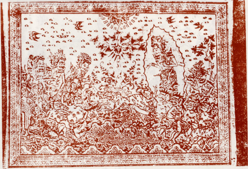
Judul : Sutasoma Ber temu Macan Pelukis : I Made Sukanta