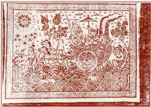
Judul : Percakapan Kresna – Arjuna Pelukis : Nyoman P. Sumantra